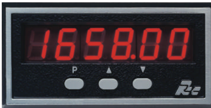
IMI in Originalgröße

Der intelligente Tachometer IMI ist ein hochgenaues Meßinstrument für den Einsatz sowohl im rauen Industriebetrieb, als auch im Prüffeld oder Labor. Er erfaßt die Eingangsfrequenz einer Impulsfolge bis zu 50 kHz und ermittelt daraus Drehzahlen, Geschwindigkeiten, Durchfluß und andere zeitbezogene Werte. Zusätzlich kann das Eingangssignal aufsummiert werden. Das überlegene Meßprinzip der Periodendauermessung und viele Optionen erlauben die Lösung auch komplexer Meß- und Überwachungsaufgaben.