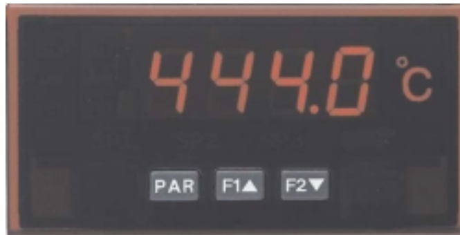
PAXLITE in Originalgröße

PAXLITE-Geräte werden im Maschinen- und Anlagenbau, in der chemischen Industrie, der Kunststoffindustrie, der Nahrungsmittelindustrie, der Verpackungs- und Fördertechnik und in vielen anderen Bereichen eingesetzt und helfen dort bei der Automatisierung und Vereinfachung von Arbeitsprozessen. Die Anzeige PAXLTC ist für den Anschluss von Thermoelementen und die Anzeige PAXLRT für den Anschluss von Pt100 geeignet. Durch die hohe Genauigkeit und die Möglichkeit einer Offset-Programmierung kann die günstige Anzeige an Ihre Messaufgaben angepasst werden..